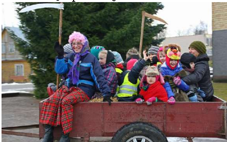
Išvažiuojam! Iki kitų Užgavėnių!