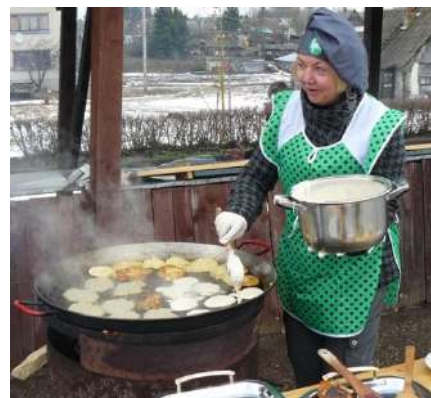
Šauniosios blynų keptojos