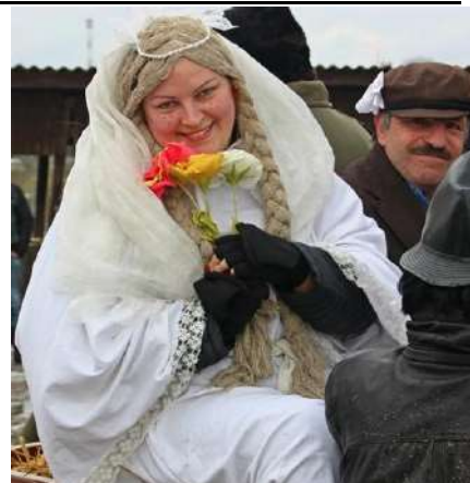
Gražesnių už jaunąją nebuvo