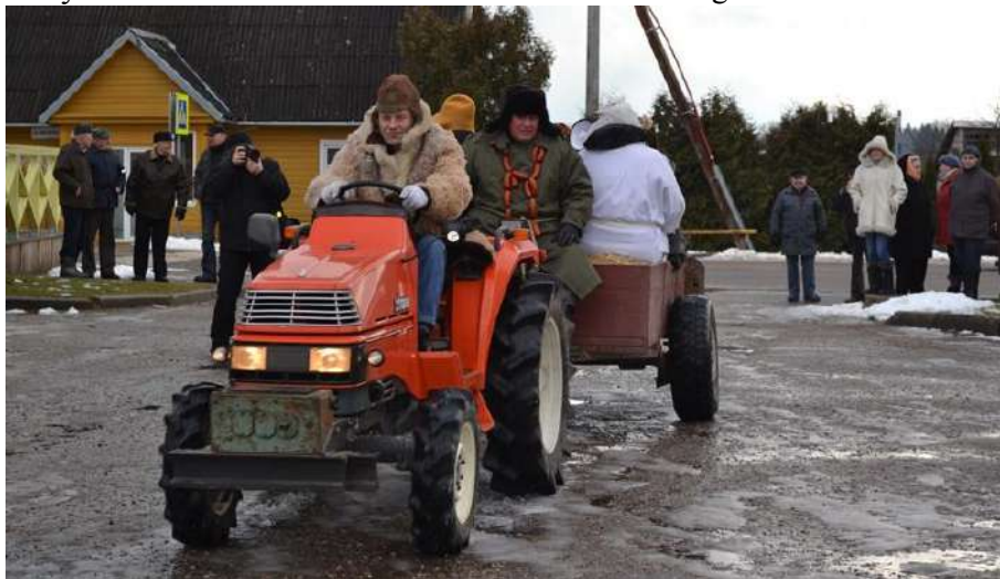
Į Užgavėnes su moderniu transportu. Arklių nebeliko...