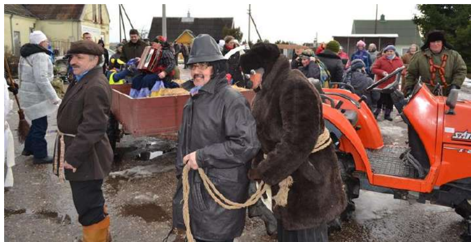
Čigonas kvietė galinėtis su meška

Redagavo ir maketavo Danguolė Grabauskienė Spausdino Utenos spaustuvė