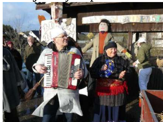
Palydīm su muziką