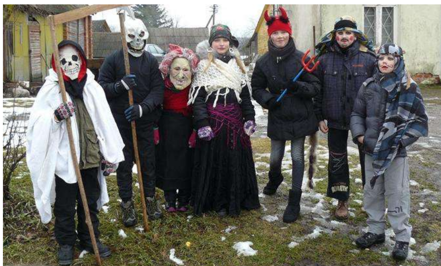
Ar atpažįstat jaunuosius Užgavėnių dalyvius?..