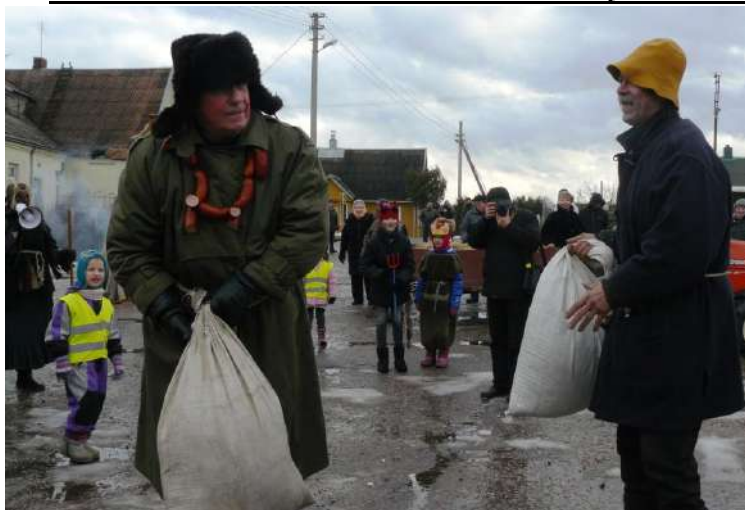
Lašininio ir Kanapinio dvikova