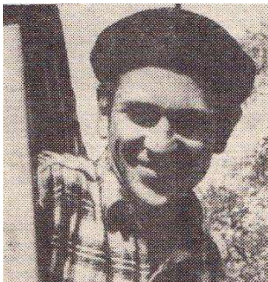
P. Ivanauskas.