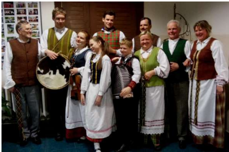
Tauragniškių ir molėtiškių kapelos po koncerto

Lapkričio 12 d. tauragniškių kapela svečių teisėmis dalyvavo Kuktiškėse vykusioje keturioliktoje liaudies kapelų ir muzikantų šventėje „Grok, armonika“.