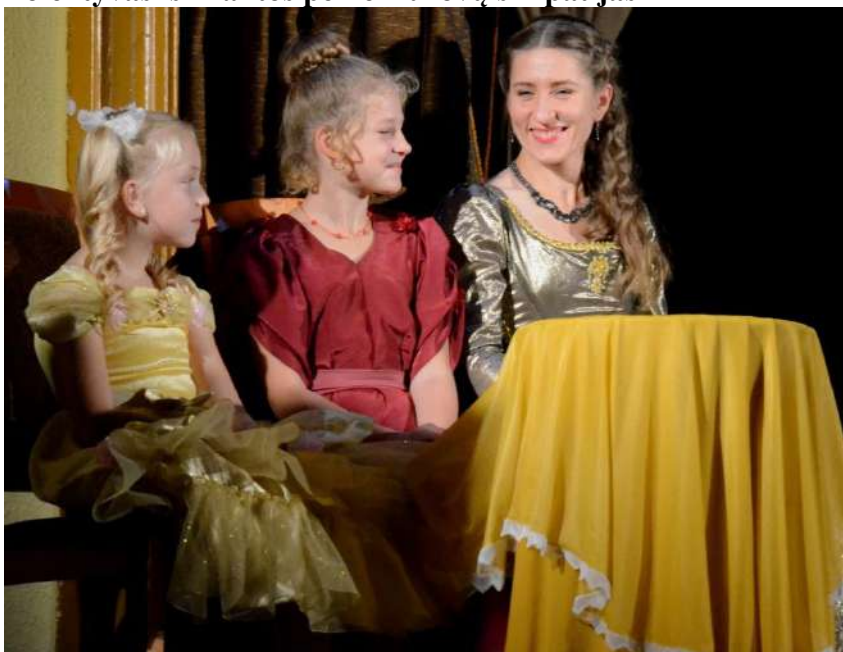
Linksmosios renginio vedėjos

ną, tai ir lakstau po laukus, pasišokinėdama kaip ožka ir dainuodama. Per radiją išgirdavau, žiūrėdama kino filmus. Anksčiau rodydavo daug indišių filmų, o juose ypač daug dainuojama, tai ir tas dainas bandydavau pakartoti, nors kiek aš ten suprasdavau! Bet dainuodavau – dainos labai anksti užpildė visą mano gyvenimą.