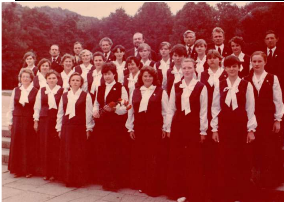
Tauragniškiai respublikinėje dainų šventėje. 1985 m.

kas. Tokio tipo dainos, kokias jie dainuoja, man labiausiai patinka. Pop muzikos nemėgstu. Operinės dainos labai patinka. Kai klausau, atrodo, jos man visos žinomos. Ir liaudies dainos labai prie širdies. Labai mėgstu gražias lyrines dainas, bet vienos išskirti niekaip negaliu – jų tiek daug“.