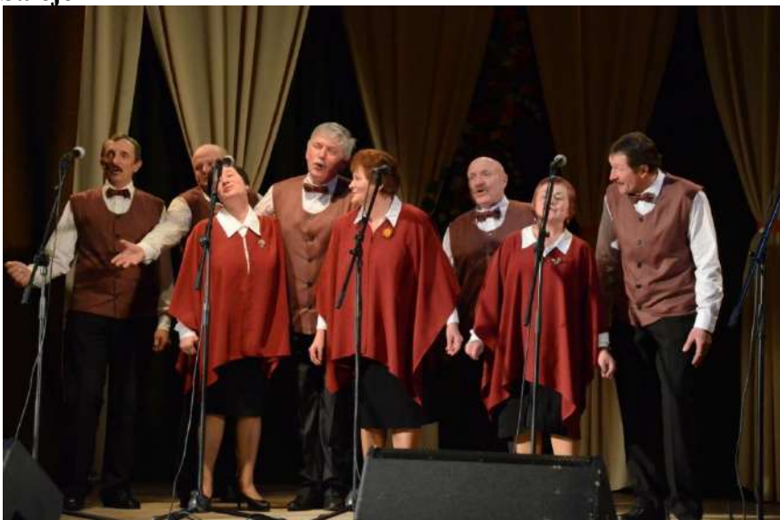
Kolektyvas iš Alantos pelnė žiūrovų simpatijas