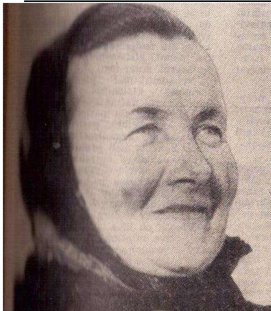
----- Atkaklumas darbe padeda Birželio 5 d.