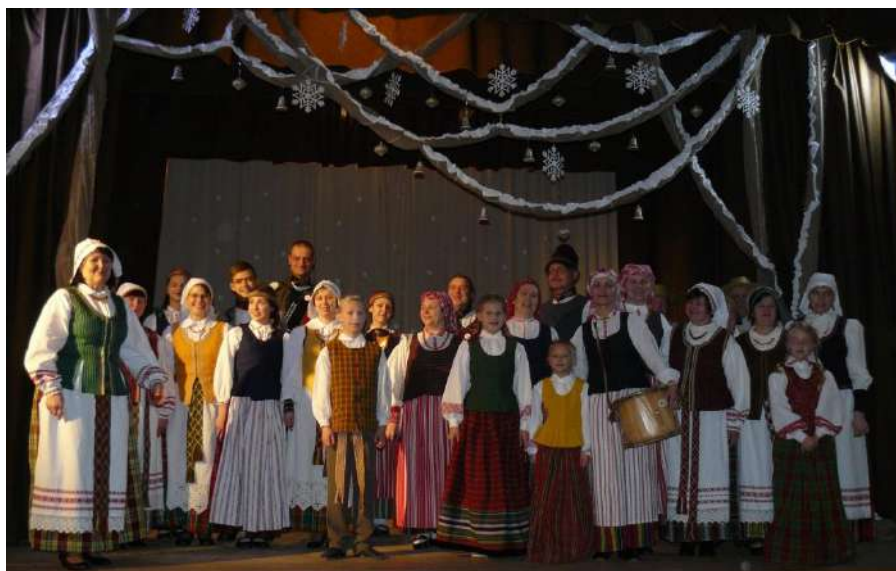
Bendra aukštaičių ir žemaičių nuotrauka

Ačiū visiems, dideliems ir mažiems. Viso projekto veiklos dar bus apžvelgtos kitame laikra-