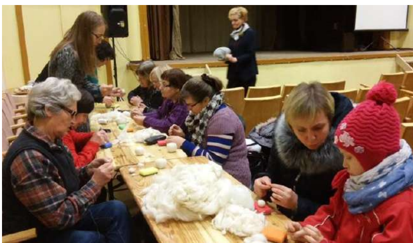
Praktinio užsiėmimo metu