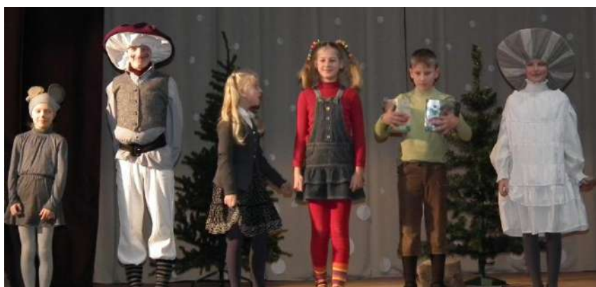
Iš kokių mes knygų?