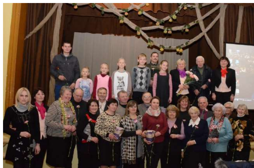
Po oficialiosios dalies sustojome bendrai nuotraukai