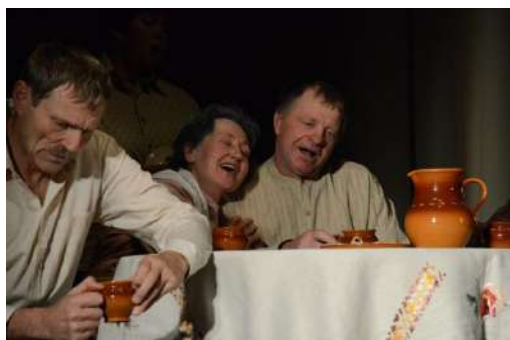
Scena iš spektaklio