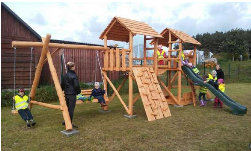
Aikštelę vaikai spėjo išbandyti

Prie sporto aikštyno įrengta vaikų žaidimų aikštelė, pastatyti keturi lauko treniruokliai, miestelio centre pastatytas stiebas vėliavai. Bendra projekto vertė 3900,75 Eur. Paramos suma – 3375,00 Eur. Tauragnų krašto bendruomenė prie projekto įgyvendinimo prisidėjo ir nuosavomis lėšomis (525,75 Eur).