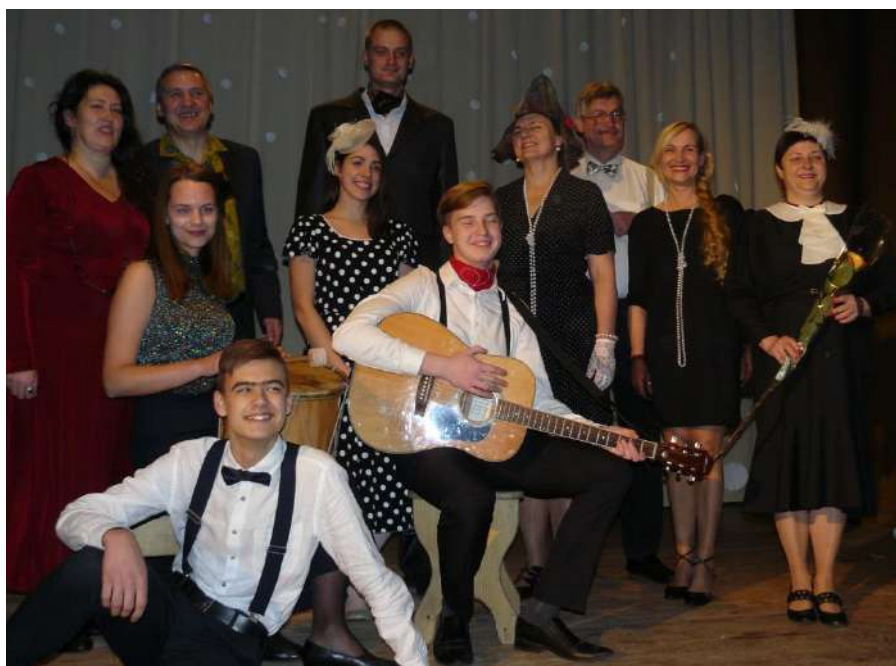
Ansamblis dainavo ir romansus