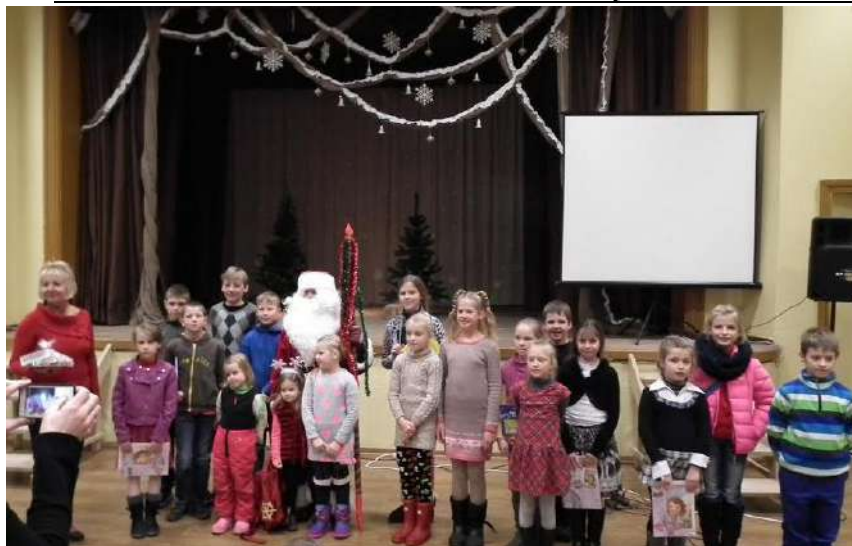
Su Kalėdų seneliu.