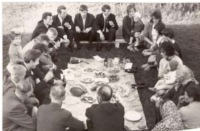
1968 m. Giminės susitikimas Vyžiuose