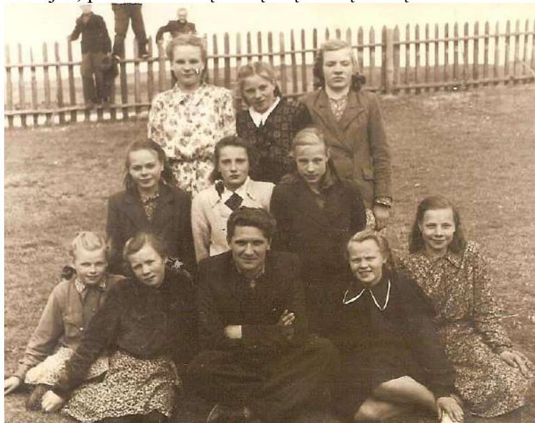
Su auklėtinėmis Tauragnuose apie 1954 m.

Po kariuomenės atvažiavau į Tauragnus, pradėjau dirbti mokykloje, turėjau pamokų ir dieninėje, ir vakarinėje (tada tokia buvo). Prieš kariuomenę mokiausi Kauno mokytojų seminarijoje, ten ruošė pradinių klasių mokytojus. Į Kauną nebegrižau, mokslus tęsiau Panevėžio pedagoginėje mokykloje neakivaizdiniame skyriuje. Mokslo pasirodė maža – pedagoginiame institute Vilniuje studijavau rusų kalbą ir literatūrą, bet nebaigiau, nes literatūra mane smaugė (o dar buvau po sunkios operacijos), todėl įstojau studijuoti istorijos, priėmė iškart į antrą ar į trečią kursą.