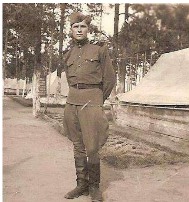
Kariuomenėje Kaliningrado srityje.

Penktą skyrių lankiau Vyžuonose, prisimenu, kaip su žydeliokais dainuodavom. Tokie dainininkai buvo! Būdavo, vienas mane vis namo kviesdavo, arbata vaišindavo. Labai su juo draugavom. 1941 m. mačiau savo draugą paskutinį kartą, kai jau buvo prasidėjęs karas. Taip skaudu prisiminti... Mokykloj buvo daug renginių, dainuodavom ir per juos. Daug