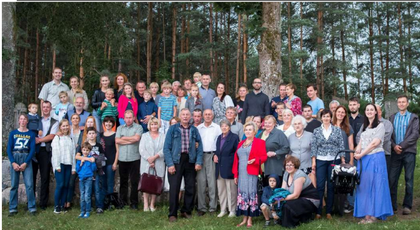
2016 m. rugpjūtis. 50-asis Šinkūnų giminės susitikimas.