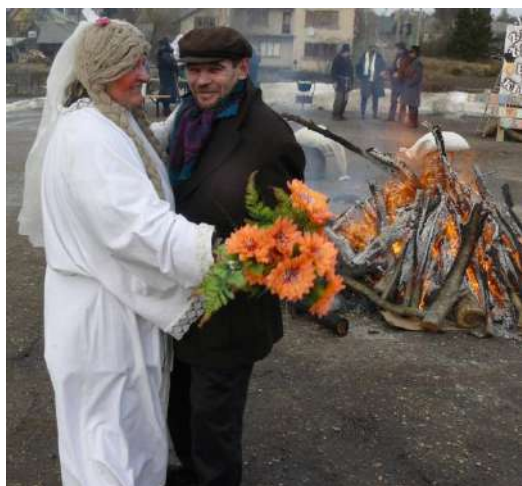
Išpūdinga jaunujų pora