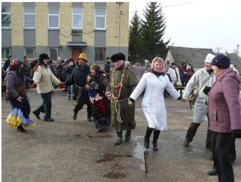
Ir be linksmybių?