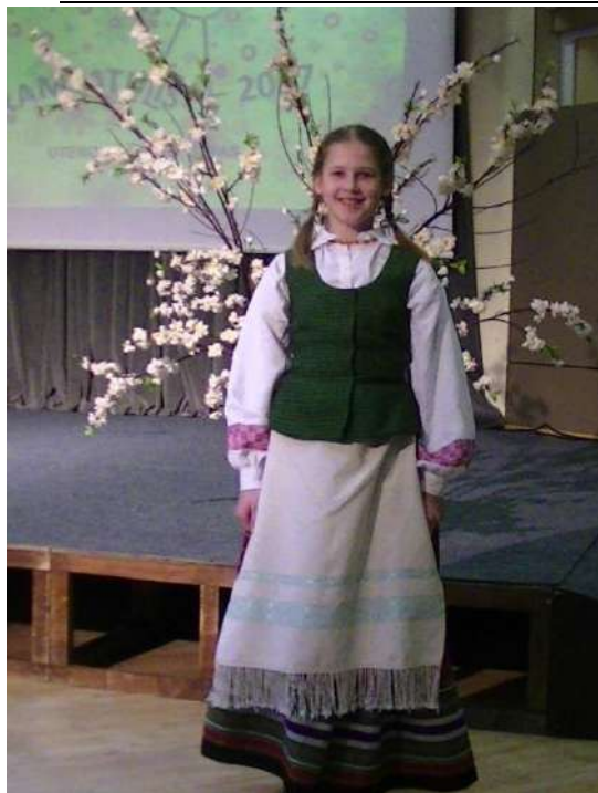
Ada po konkurso Utenoje