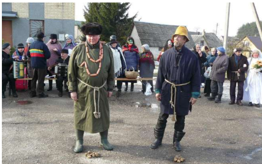
Lašininis ir Kanapinis

Per Užgavėnes ne tik šokome, bet vyko įvairios rungtys: bulvių mėtymas į „kašelę“, veltinio metimas, kas toliau nusiųs, Kanapinio ir Lašininio kova, virvės traukimas.