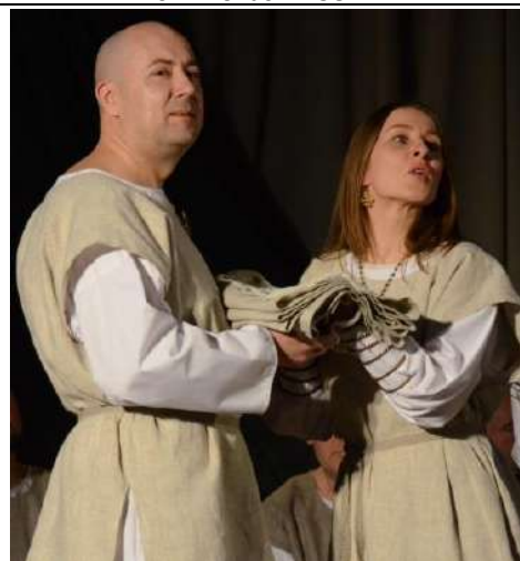
Scena iš spektaklio „Undeniu, ugniu, žalynais“