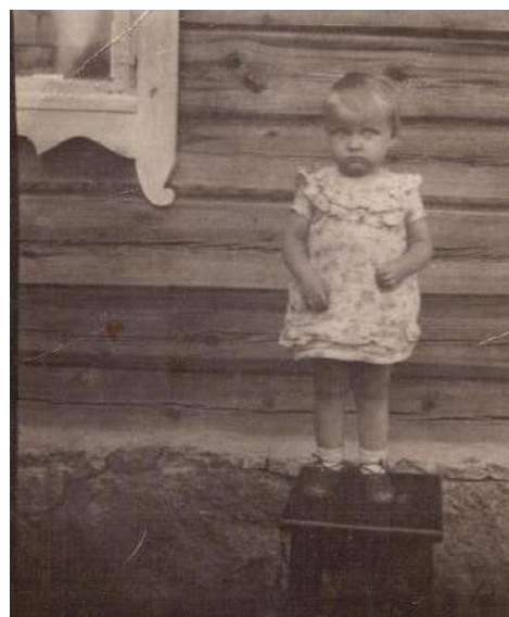
Pirmoji nuotrauka. 1938 ar 1939 metai