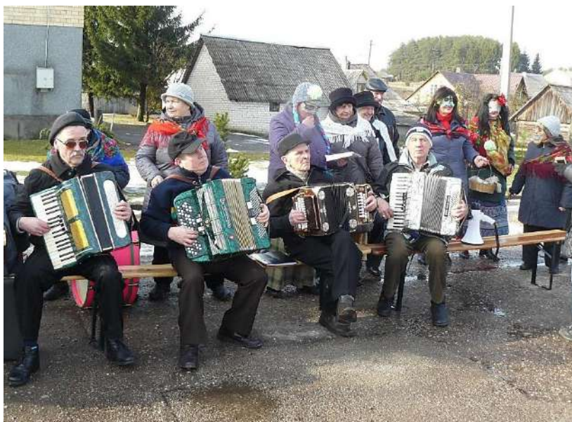
Muzikantai grojo nepailsdami