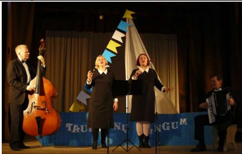
Ansamblis „Trys viename“