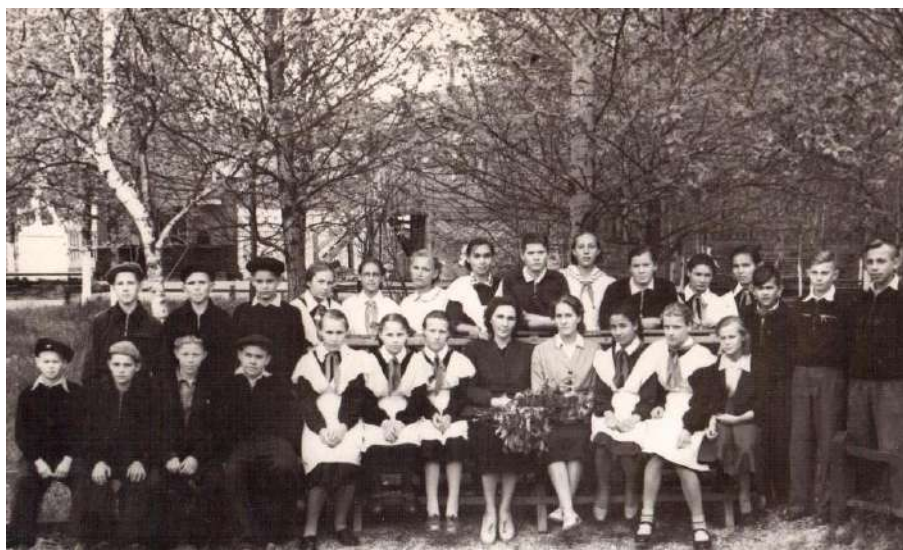
Chabarovsko kraštas. Iš dviejų 7 kl. subūrėm dainos mylėtojų grupę. 1959 m.