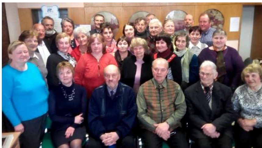
Po knygos pristatymo