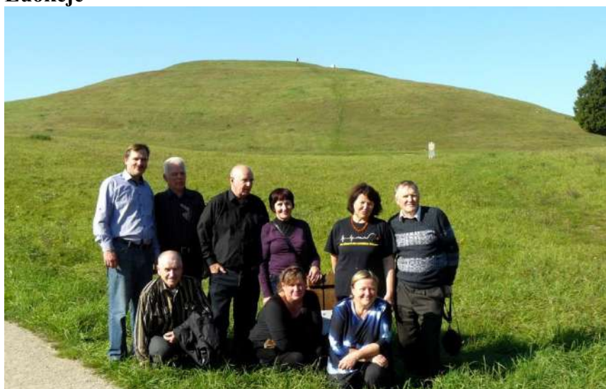
Prie Šatrijos piliakalnio