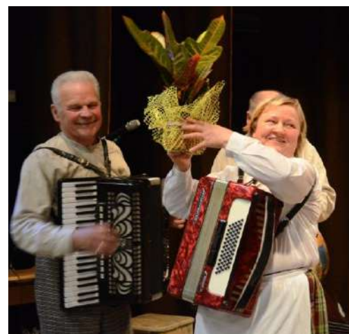
Gėlės kapelos vadovei

Projektas tęsis iki metų pabaigos, tačiau tikimasi, kad Utenos rajono savivaldybė ir kitais metais jį finansuos. Galbūt kaimuose yra ir daugiau žmonių, kuriems reikalinga įvairi pagalba: atnešti malkų, maisto produktų iš parduotuvės, padėti apsitvarkyti namuose ir pan. Būtų gerai, jei apie tai pranešumėte socialinei darbuotojai ar bendruomenės pirmininkei.