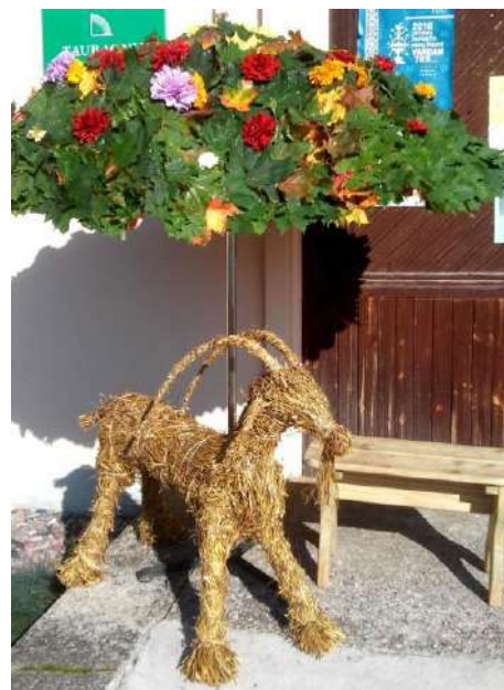
Oželis, kuris bus paaukotas