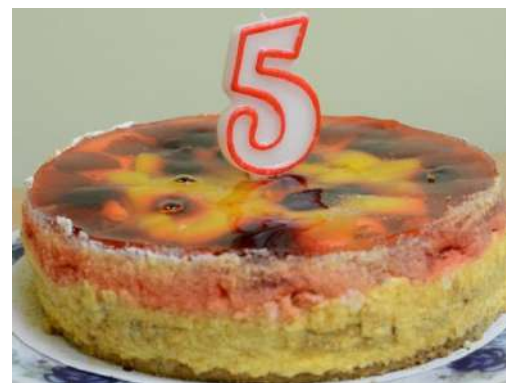
Kapelai „Tauragna“ – penkeri