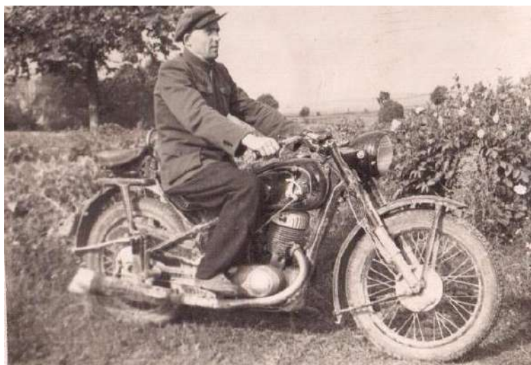
Šiuo motociklu važiuodavo į Švenčionėlius pirkti duonos.