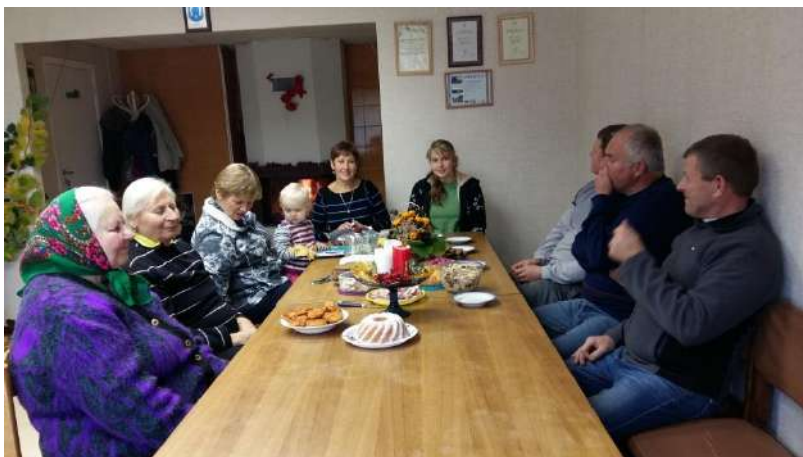
Derliaus diena bendruomenėje

Liepos–gruodžio mėnesį Klykių bendruomenėje vykdomas socialinis projektas – „Specialių socialinių paslaugų teikimas namuose senyvo amžiaus ir suaugusiems asmenims su negalia.“ Projektą finansuoja Utenos rajono savivaldybė iš Utenos rajono savivaldybės socialinių paslaugų plėtros kokybės gerinimo programos ir skyrė 1919 eurų. Šio projekto metu buvo įdarbintas vienas žmogus, kuris teikia socialines paslaugas šešiams žmonėms.