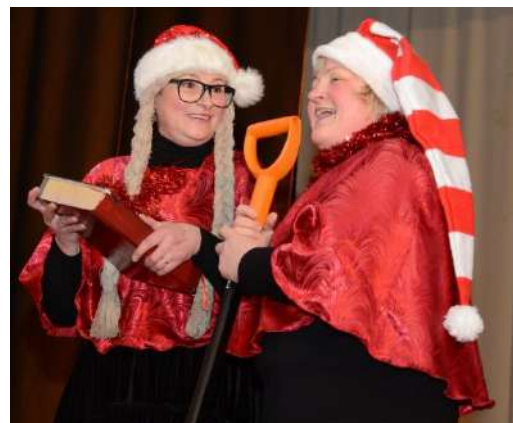
Nuotraukose: Kalėdinio renginio akimirkos.