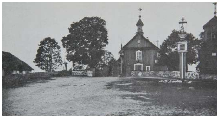
Tauragnų bažnyčia, sudegusi 1944 m.

1944 m. veikė progimnazija, 1945 m. įsteigta biblioteka, 1947 m. ambulatorija pertvarkyta į ligoninę, (veikė iki 1974 m.). Bažnyčia įrengta parapijos salėje.