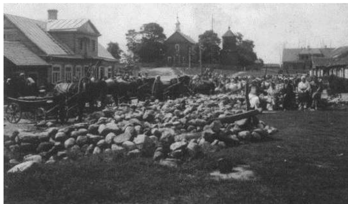
Miestelio aikštė, akmenys gatvėms grįsti. 1934 m.

1935 m. pastatyta nauja medinė mokykla. Iškilio 400 vietų parapijos salė.