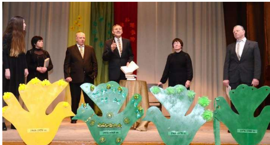
Publicistinė kompozicija „Iš svajonių gimsta tikrenybės“