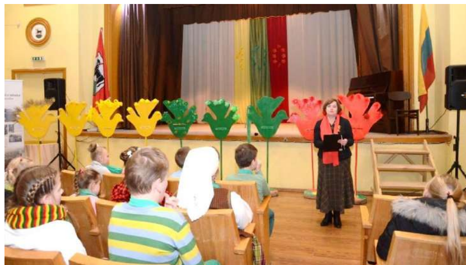
Šimtmečio paukščiai ant savo sparnų „atnešė“ Tauragnų dešimtmečių istoriją

Kita diena po vasario 16-osios, vasario 17-a, ir dar kitos dienos buvo tokios pačios. Nutarimas buvo pasirašytas, paskelbtas, bet valstybės jis nesukūrė. Laukė sunkus valstybės pagrindų kūrimo darbas, o vokiečių okupacinė valdžia tik dar labiau sunkino padėtį. Po Nepriklausomybės atkūrimo paskelbimo Lietuvą toliau valdė vokiečiai. Jie reikalavo, kad Lietuvos Taryba paskelbtų amžinąją sąjungą su