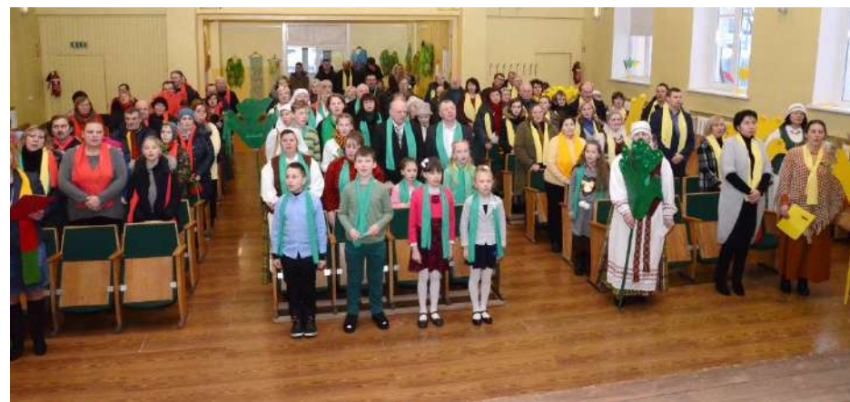
Giedame Tautišką giesmę