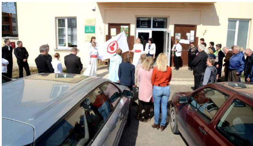
Tuoj bus iškelta Taikos vėliava

Rusų mąstytojas Nikolajus Rerichas daug keliavo po pasaulį ir matė daugybę gražių meno paminklų, kuriuos būtina išsaugoti. Dar 1929 metais jis kreipėsi į visų šalių valstybinius ir meno atstovus, kviesdamas aptarti kultūros paminklų apsaugos klausimą. Jo prašymu prancūzų juristai parengė paktą, kuris buvo paskelbtas įvairiomis kalbomis kartu su N. Rericho kreipimusi.