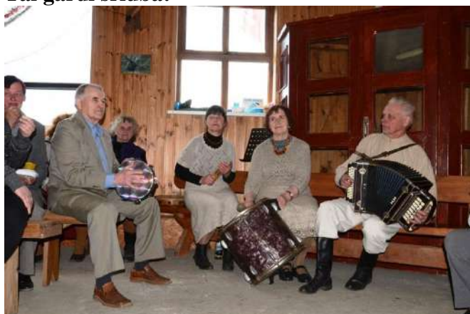
Linksmo kaimo muzikantai