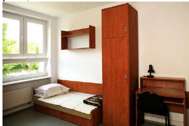
Taip atrodo kambariai

Papildomai lankomi objektai – apie 30 eurų/suaugę, 20 eurų/vaikams (autobuso parkuotės šalia lankomų objektų, Vilko guolis-A. Hitlerio vadavietė, plaukimas laiveliu iš Gdanko į Sopotą (jei plauksim), Marienburgo pilis...)