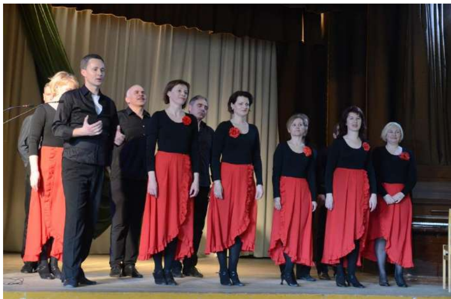
Sportinių šokių kolektyvas „Slingas“

1935 metų balandžio 15 dieną Vašingtone JAV prezidento F. Ruzvelto kabinete 21 Amerikos žemyno šalies atstovai pasirašė sutartį dėl meno ir mokslo įstaigų bei istorinių paminklų išsaugojimo. Simboliu pasirinkta Taikos vėliava – baltame fone raudonos spalvos žiedas, juosiantis tris raudonus apskritimus. Taika amžinybės rate – tai menas, mokslas ir religija, tai tikėjimas, ramybė ir sutarimas, kurie taip reikalingi sudėtingame šiuolaikiniame pasaulyje tarp religijų, tarp kartų, tarp tautų.