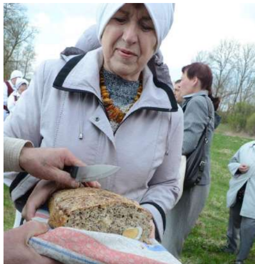
Dalinamės Jurginių duona