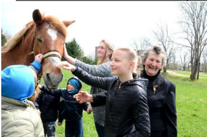
Arkliukas patiko visiems