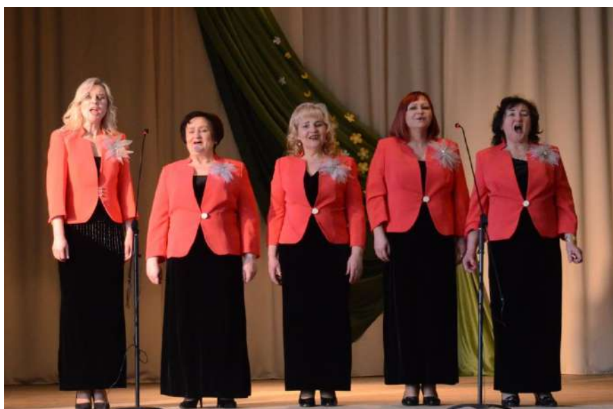
Vyžuonų kultūros skyriaus moterų ansamblis „Versmė“