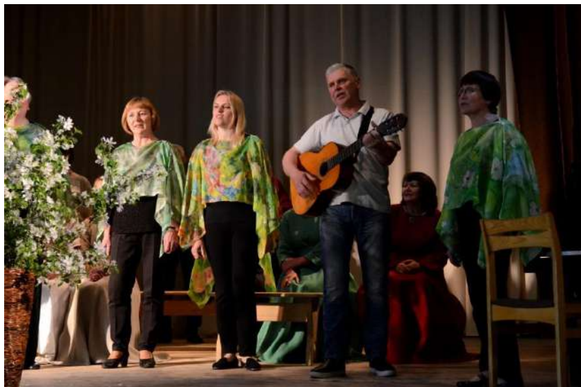
Kompozicija „Kaip žydėjimas vyšnios“