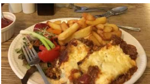
Porcija lazanijos kavinėje. Skanu, bet visko per daug