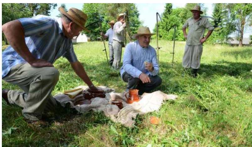
Poilsio akimirka. Blynai su dažiniu.