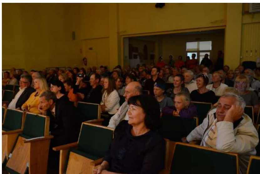
Žiurovų salėje netrūko abi dienas