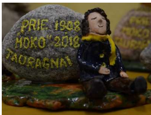
Teatrų kolektyvams buvo įteikti originalūs suvenyrai