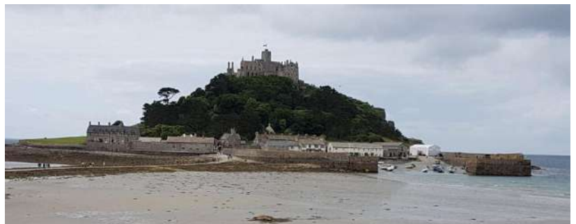
Šv. Mykolo kalnas