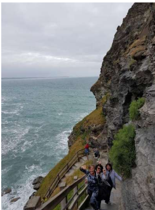
Aukštoka, tačiau visai saugu