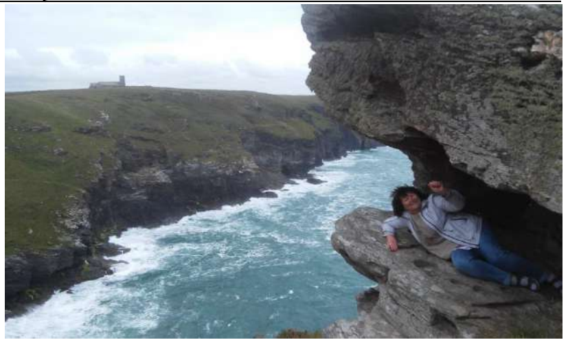
Ir visai nebaisu