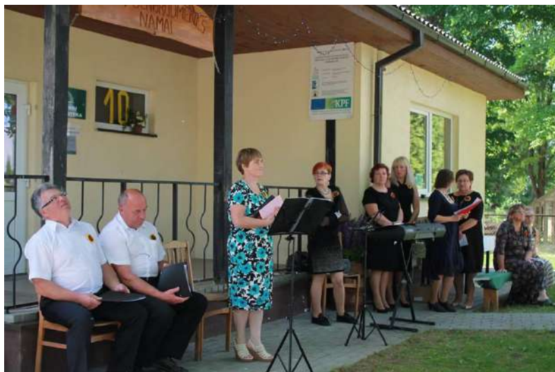
Pristatomi svečiai iš Kuktiškių

Dar ilgai netilo muzika ir dainos ažuolo pavėsyje. Ačiū visiems dalyvavusiems.