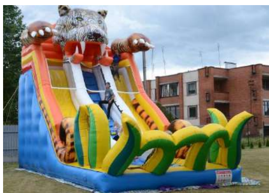
Vaikų laukė batutas