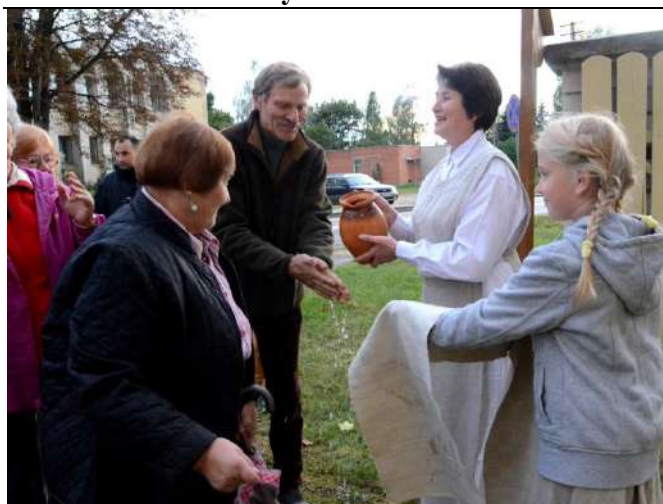
Pro vartus įeinant