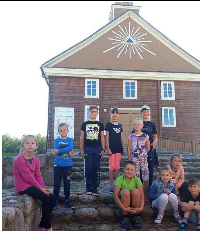
Prie Labanoro bažnyčios