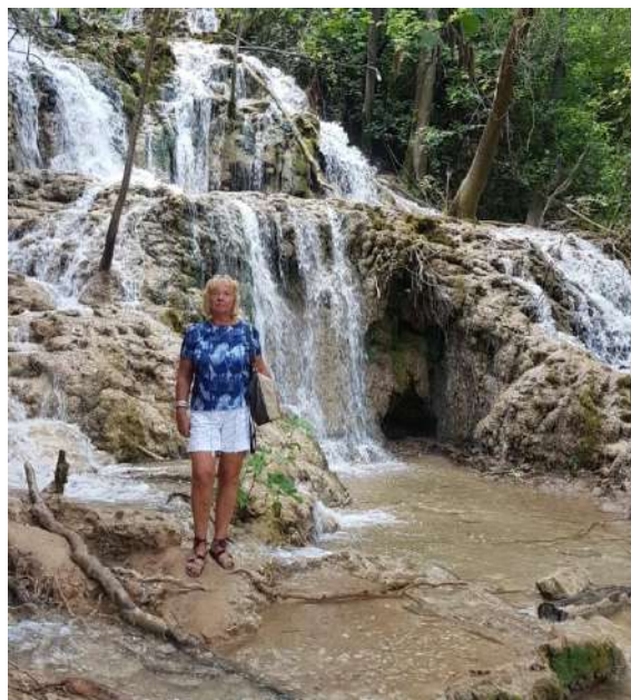
Krka nacionaliniame parke