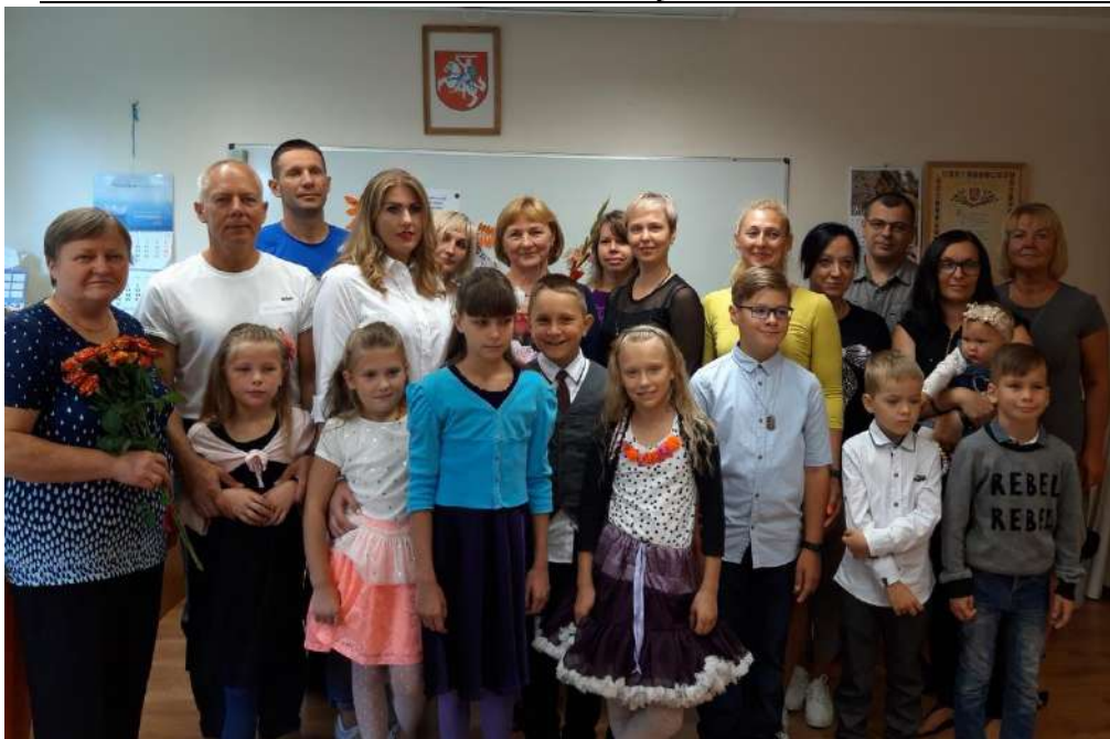
Rugsėjo 1-oji mokykloje