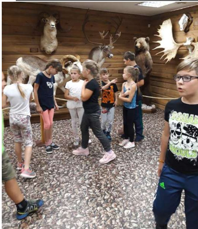
Antano Truskausko medžioklės ir gamtos muziejuje