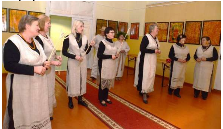
Moterų folklorinis ansamblis