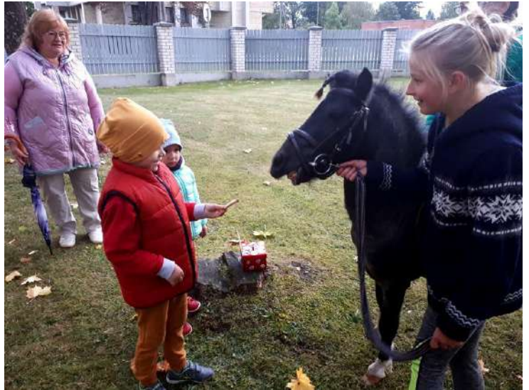
Susipažįstame su Goša