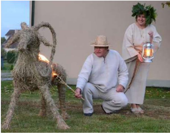
Oželis tuoj bus paaukotas