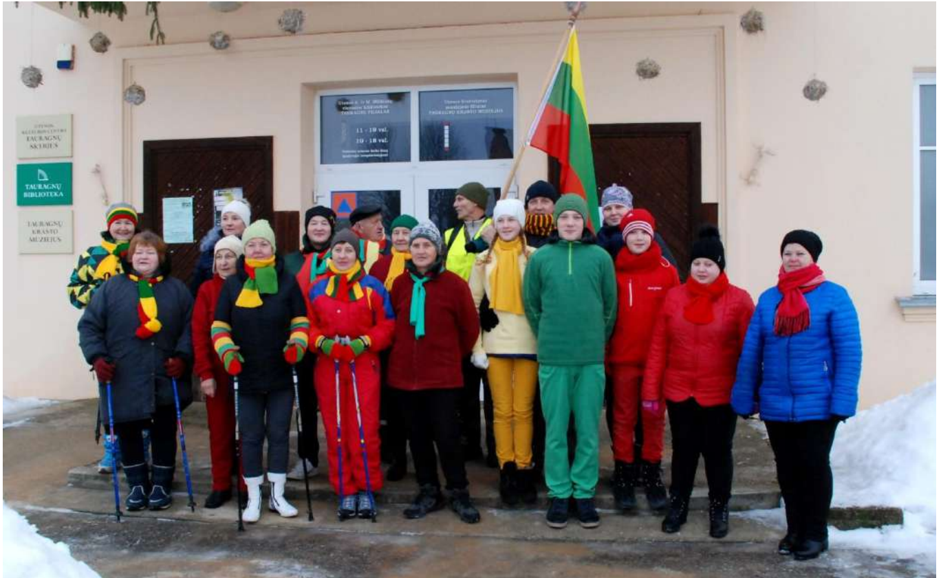
Tauragniškių būrelis žygiui pasiruošęs