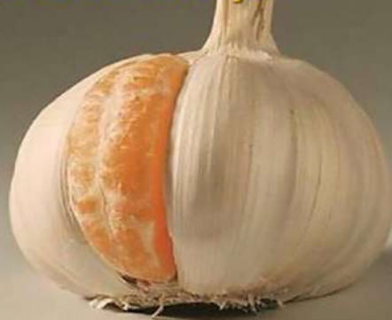
Pamąstymui (iš interneto)

Net jei jūs tinkate, tai dar nereiškia, kad jūs savo vietoje!