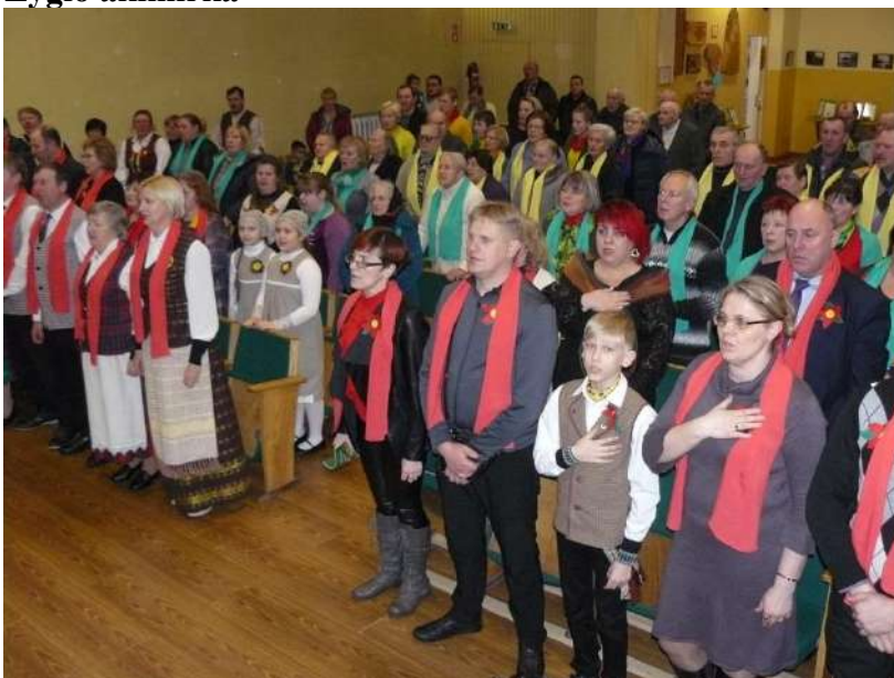
Salėje. Giedame himną.