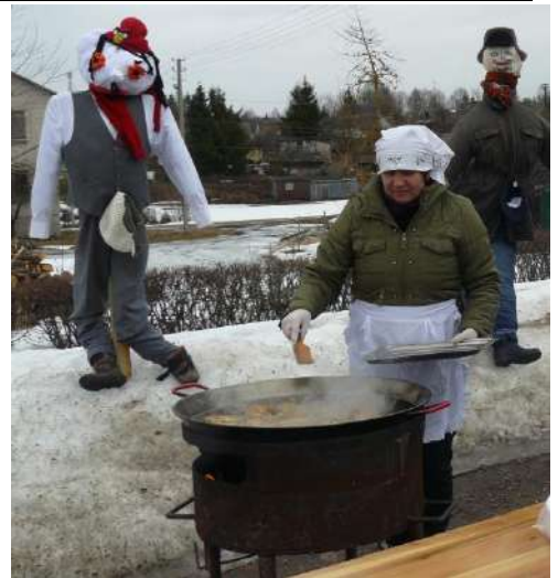
Tai blynų skanumas!