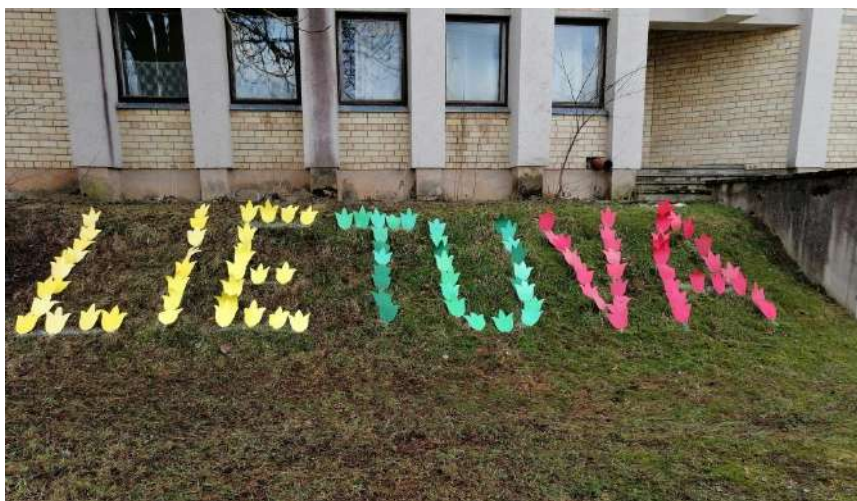
Lietuva pražydo tulpėmis