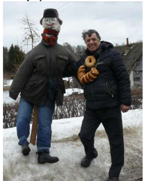
Medžiotojų gatvės Gavėnas buvo sudegintas