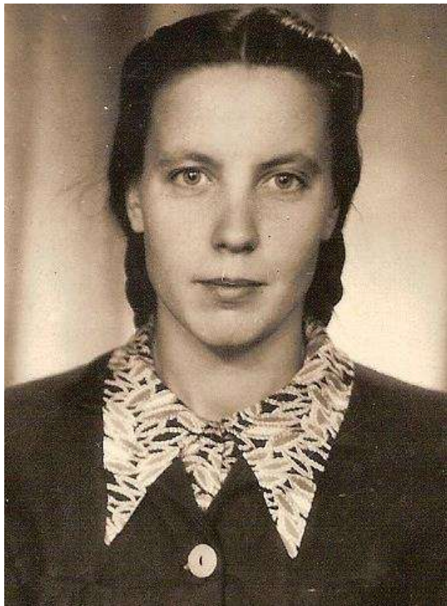
Jaunystėje. 1956 m.

Aš niekaip nesuprantu, kaip ir vaikus auginau, ir ūkį sugebėjau prižiūrėti. Buvo žiemos laikas. Tvarte arklys, karvė, avelė, reikia vandens atsinešti, pečių kūrenti. Ateidavo toks dėdė padė-