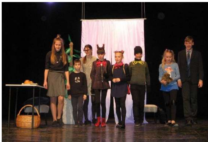
Po spektaklio Pasvalyje