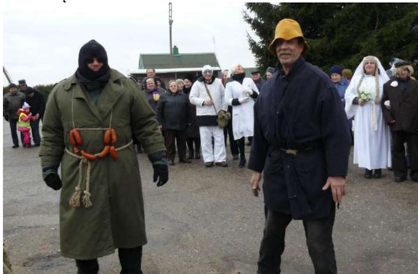
Tuoj susikaus Lašininis ir Kanapinis